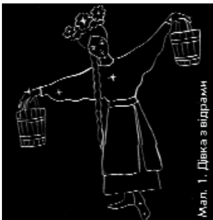
Мал. 1. Дівка з відрами

Сучасне сузір'я Орла в Україні мало назву — Дівка з відрами . Легко здогадатися чому — через зовнішню схожість