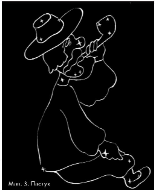
Мал. 3. Пастух

роба. П'ять яскравих зір справді нагадують примітивну борону. Сучасним жителям міст, які у своїй більшості не мають уявлення про це знаряддя праці, п'ятизір'я Кассіопеї швидше нагадує літеру W з латинської абетки. ►